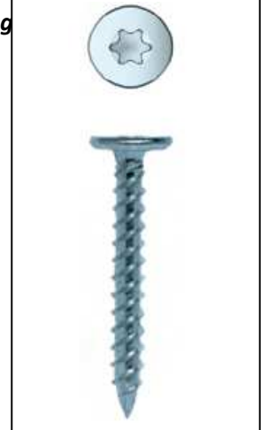
Imagen de producto / Product picture