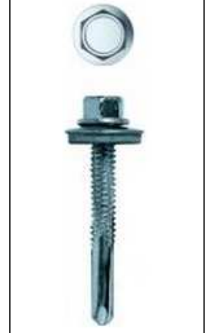
Imagen de producto/ Product picture